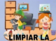
LIMPIAR LA CASA