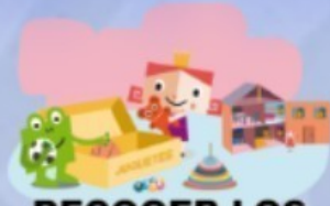
RECOGER LOS JUGUETES