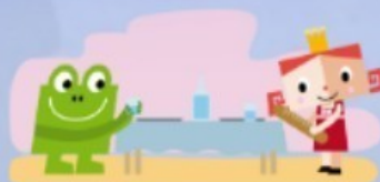
PONER LA MESA