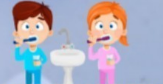
LAVARSE LOS DIENTES